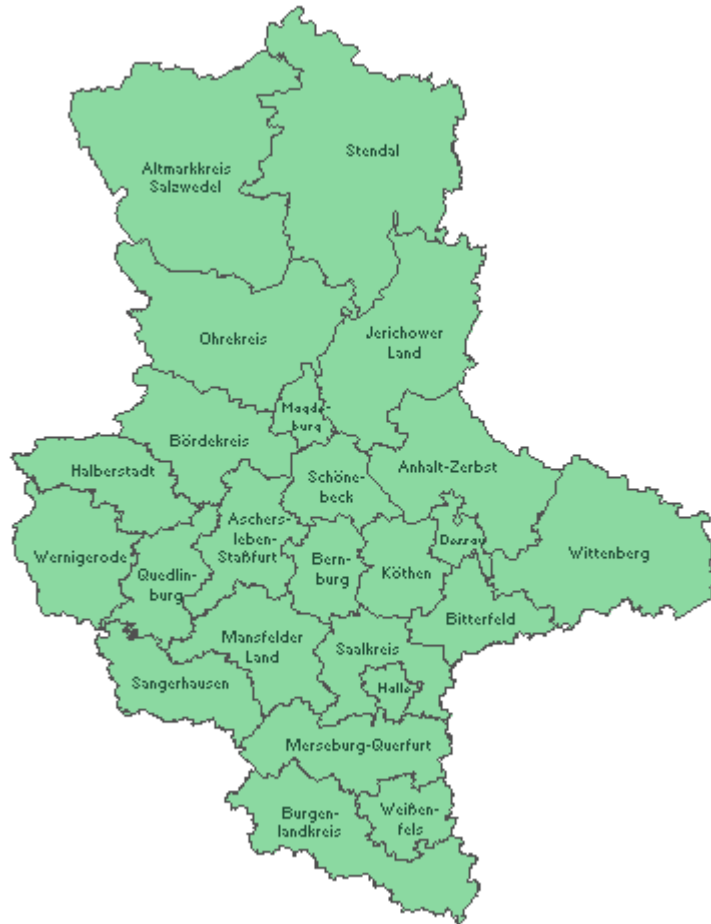
Regionale Gliederung ab 01.07.2007